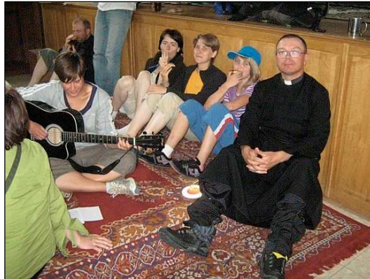
Pihenő az ószandeci plébánián

a szemük, mikor meghallották, hogy Krakóba, Lengyelországba. Napi teljesítményünk 25-41 km volt, 5-8 kilométerenként általában félórás pihenővel. Ilyenkor a templomban hálát adtunk a megtett útért, és a templomkertben vagy a plébánián igyekeztünk felfrissülni és erőt gyűjteni a következő szakaszhoz. A legelső megállóknál épp egész napos szentségimádás folyt, ott várt minket Jézus.