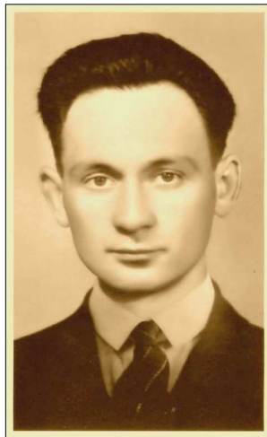
Boldog Sándor István, könyörögj értünk!

Hálásan köszönünk minden imát és adományt is! (a szerkesztő)